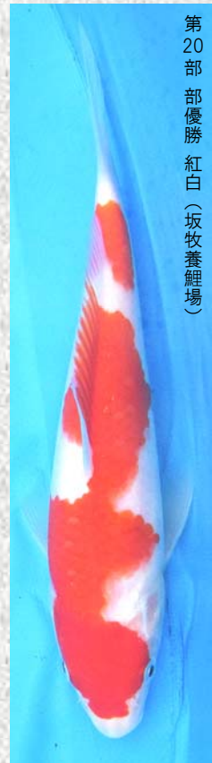
※支所日よりカラー版は長岡市ホームページでご覧いただけます。 第20部 部優勝 紅白(坂牧養鯉場)