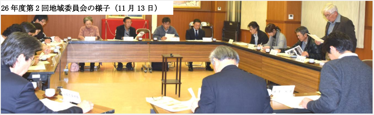
26年度第2回地域委員会の様子(11月13日)

25年度からは、第一、第二分科会を設置し、それぞれの視点から地域の課題解決を図っています。