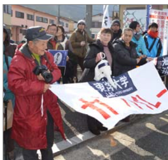
箱根駅伝・東洋大優勝!