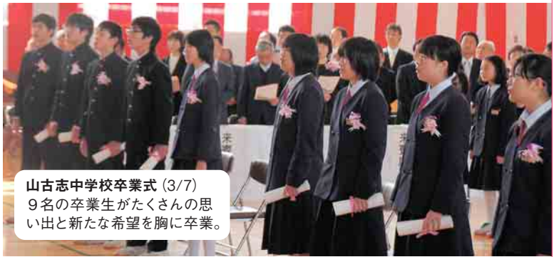
山古志中学校卒業式(3/7) 9名の卒業生がたくさん の思い出と新たな希望を胸に卒業。