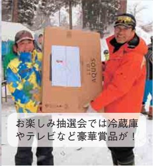
お楽しみ抽選会では冷蔵庫やテレビなど豪華賞品が!