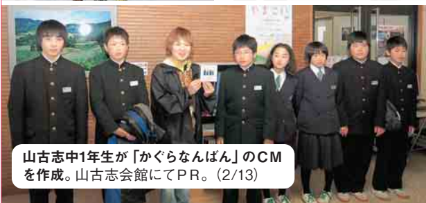
山古志中1年生が「かぐらなんばん」のCMを作成。山古志会館にてPR。(2/13)