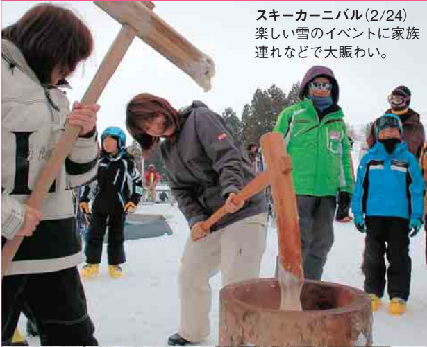
スキーカーニバル(2/24) 楽しい雪のイベントに家族 連れなどで大賑わい。