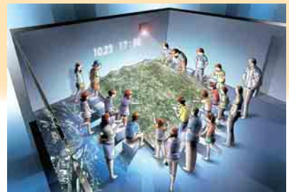
地形模型シアター

問合せ：やまこし復興交流館準備室 (☎41-1203) 地域振興課 地域振興・防災係 (☎59-2328)