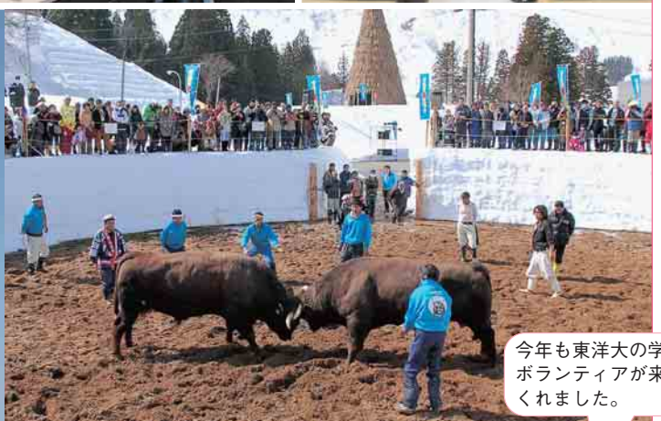
今年も東洋大の学生ボランティアが来てくれました。