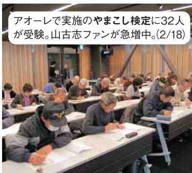
アオーレで実施のやまこし検定に32人が受験。山古志ファンが急増中。(2/18)