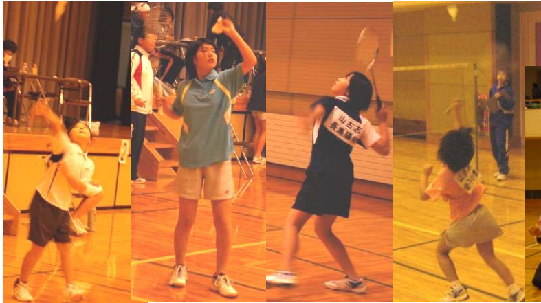
←山古志近郷の小中学生選手が集結したバドミントン大会。山古志の子ども達も参加し大健闘。(12/3)