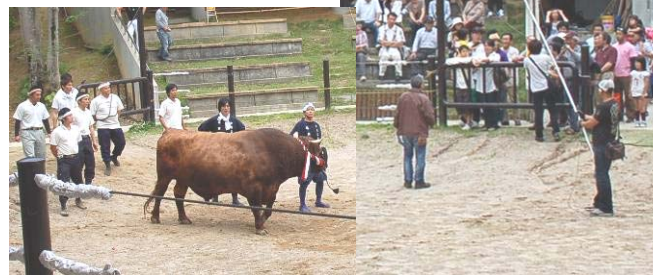
闘牛シーンの撮影の様子（6/19）。花嫁の父は山古志で牛を飼っているという設定。

古志の火まつりや雪の山古志、棚田など山古志の絶景を盛り込み、親子の絆を描いています。