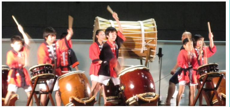
↑ハイブ長岡で行われた和太鼓の祭典に山古志子ども太鼓会が参加。敬老会や産業まつりなどでの演奏を経験してきた子どもたち、大きな舞台でも落ち着いて見事な演奏を披露。(12/4)