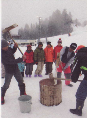
①古志高原スキー場スキーカーニバル ふるまいやお楽しみ抽選会、スキー教室と盛りだくさんの内容でした。