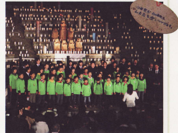
⑨山古志地域 追悼式 震災6周年となる追悼式で山古志闘牛場観客席に3,000個の灯籠を点火。山古志小・中学生が復興の思いを込めた歌を合唱しました。