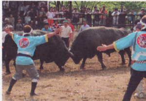
③牛の角突き初場所 新緑のブナがまぶしい山古志闘牛場に勢子の掛け声と観客の歓声がこだましました。