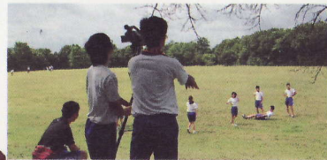
⑥山古志中学3年生が映画づくり 中越震災を振り返るドキュメンタリー映画づくり。仮設住宅のあったニュータウンで撮影スタート。