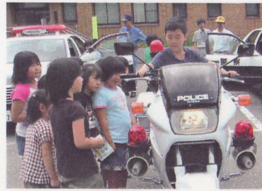
④山古志地域交通安全教室 自転車教室やパトカー・白バイの試乗体験、警察音楽隊演奏会など楽しみながら交通安全を学習。