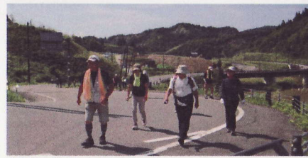
⑦今年も開催、山古志ウオーク 県内外から約700人が参加し、秋の山古志を満喫しました。