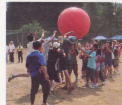
⑤山古志地域総合レクリエーション大会 小中学校グラウンドでの開催は6年ぶり。分館対抗で玉入れや綱引きなど大熱戦。優勝は池谷・東竹沢合同チーム。