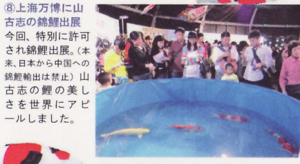
⑧上海万博に山古志の錦鯉出展 今回、特別に許可され錦鯉出展。(本来、日本から中国への錦鯉輸出は禁止)山古志の鯉の美しさを世界にアピールしました。