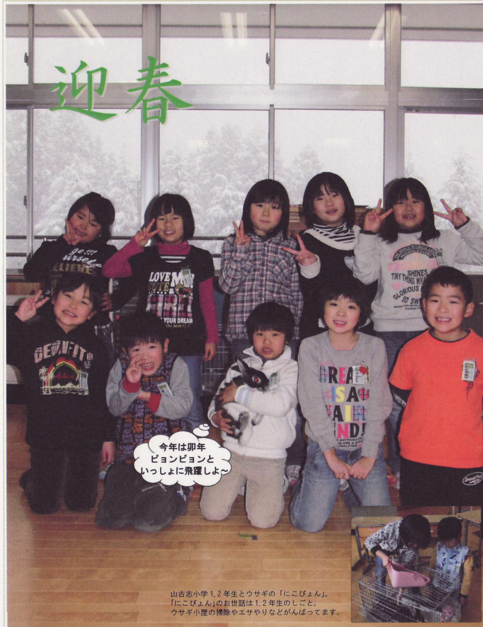
山古志小学1,2年生とウサギの「にこびよん」。「にこびよん」のお世話は1,2年生のしごと。ウサギ小屋の掃除やエサやりなどががんばってます。

編集・発行 長岡市山古志支所地域振興課地域振興・防災係 〒947-0204 長岡市山古志竹沢乙461 電話：0258-59-2330 FAX：0258-59-2331 Eメール：ymks-chiiki@city.nagaoka.lg.jp