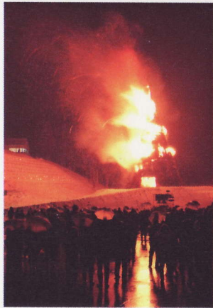
②古志の火まつり 地域の方から刈っていただいたカヤで作成した高さ25mの巨大さいの神。天高く燃え上がる炎が、山古志の春を運んできます。