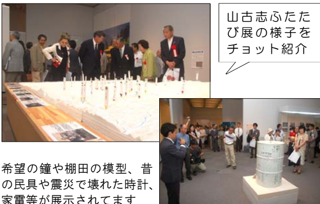
山古志ふたたび展の様子を チョット紹介