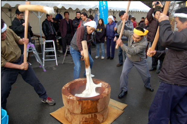
上：やまこし帰村式では多くの住民も山古志から参加 中：陽光台総合集会所「感謝の集い」の様子 下：その場でついた杵つきもちをふるまいました