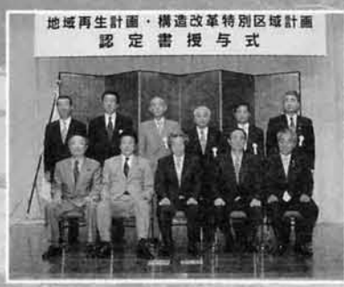
構造改革特区認定書授与式

今回の認定は企業の農業参入に関与するもので、今後村との協働により農地の流動化を進め、新規農作物の開拓や市民農園等、交流事業につなげたいと考えています。