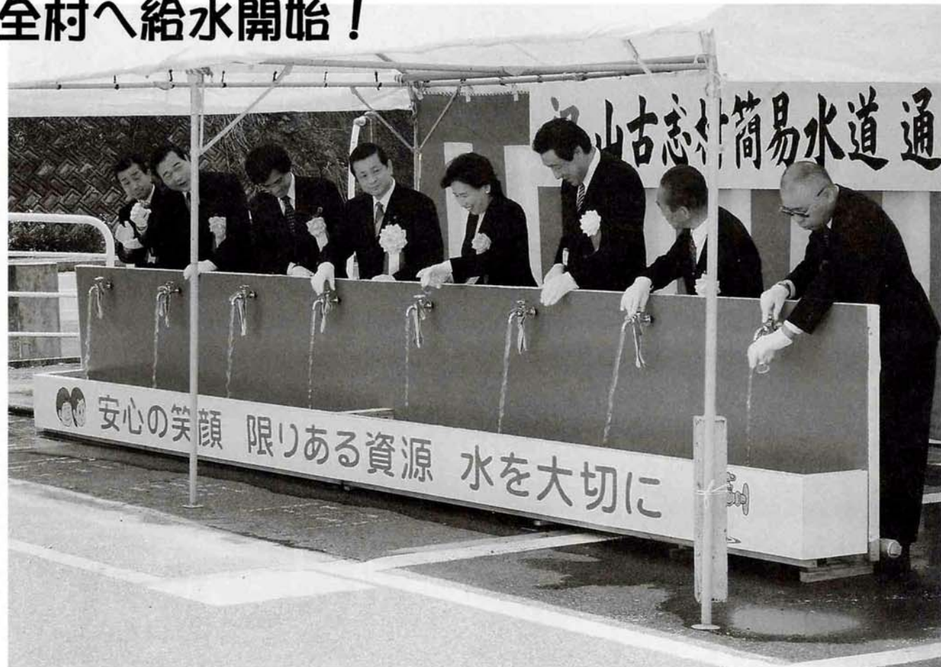
山古志村簡易水道通水式