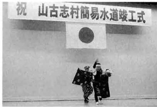
水道事業の完成を祝う大久保神楽

村では村内全域に給水するため、平成十年から事業に着手以来、早期給水開始に向けて事業推進を図り、このたび村内全域に給水が可能となりました。