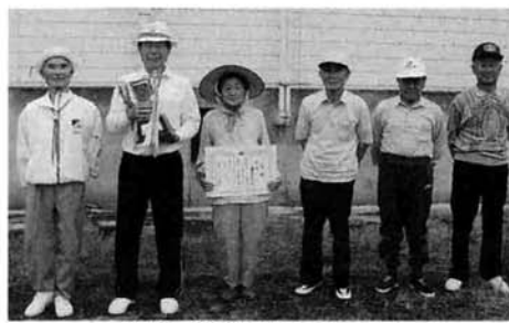
優勝「種芋原1チーム」