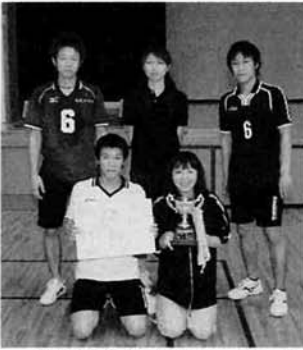
一般の部優勝「アタック24」