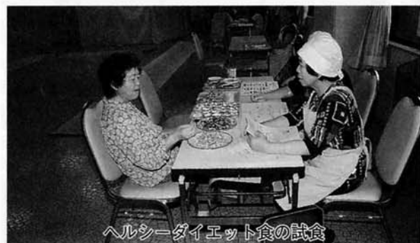
ヘルシーダイエット食の試食

住民の健康づくりと病気の早期発見を目指して行われたこの健診には426名の方が受診しました。村では七月二十七日から各集落センターごとに「健康さんいらっしやい」と題して事後指導会を実施します。下記の日程で開催しますのでぜひおいでください。「異常なし」の方も、「何らかの異常が見つかった」方も、基本健診の結果は、自分の体の状態を知る貴重な資料です。