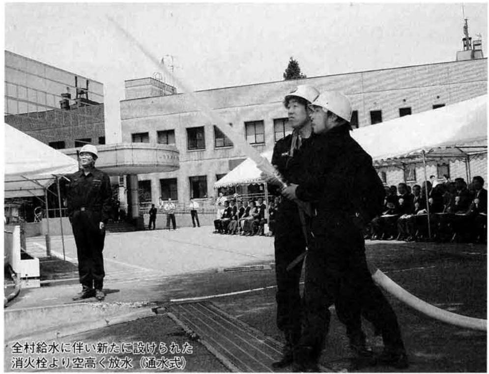
全村給水に伴い新たに設けられた消火栓より空高く放水(通水式)

6月2日(水)山古志村簡易水道 事に降水量の少ない夏場の水不足の通水式が行われました。山古志村の飲料水は、平成七年に簡易水道の完成した虫亀地区を除き、井戸水に頼っており、