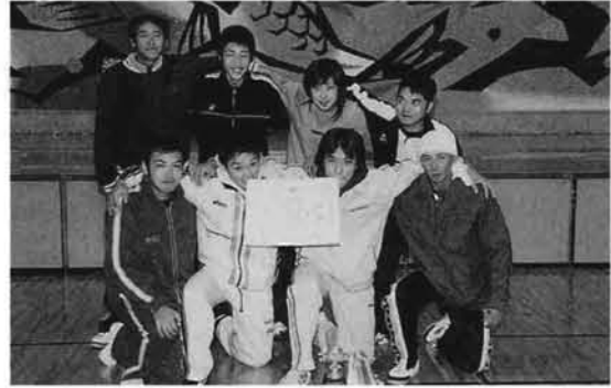
優勝した梅ロイヤル

そして、会場を村民体育館に移して祝賀会が開催され、今までの思い出など、大いに盛り上がりました。