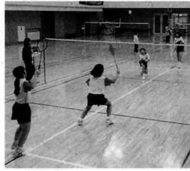
結果は次のとおりです。

初めて大会に出場する選手もいましたが、どの選手も寒さに負けることなく、精一杯のプレーをしていました。