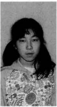
(六年・油夫・盛司さん方)

今年、小学生から中学生に算数から数学へ変わります。だから、ただでさえ苦手な算数を得意にしたいです。それと部活などもがんばりたいです。