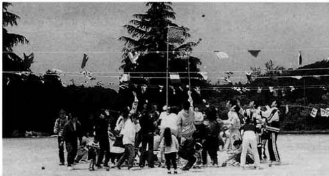
お父さん・お母さんもガンバリました!