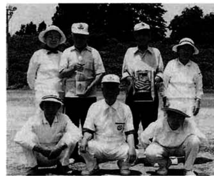
優勝した竹沢チーム