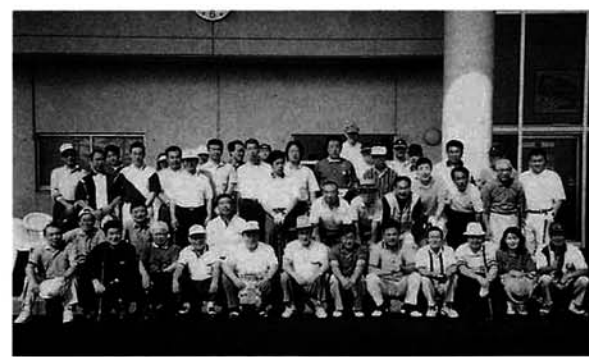
スタート前にハイチーズ

大会では豪快にボールを飛ばし、ナイスショットの音が飛び交っていたようです。天候にも恵まれ楽しい一日を過ごしました。村長による始球式も行われ盛り上がった大会となりました。第七回大会の成績は次のとおりです。