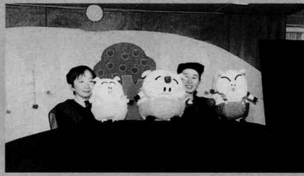
カワイイ3びきの子ブタさん

六月八日竹沢保育所で、人形劇が行われました。種李原保育所の園児も参加し、みんなで人形劇「三びきの子ブタ」を楽しく見る事が出来ました。園児たちは人形劇が始まると目もそらずに真剣に見入っていましたがおかみの味方になって子ブタの隠れている場所を教える子もいたり、子ブタの応援をしたり、しだいに元気な声で応援していました。園児たちが無邪気で元気な姿を見るととても微笑ましく感じられました。