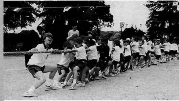
みんなで力を合わせて綱引き

六月四日(日)第一回山古志小学校運動会が同校グラウンドで天候に恵まれて行われました。赤組・白組に分かれた八十四名の児童が練習を重ねてきた競技や応援を一生懸命している姿がとても印象的でした。みんな考えて応援歌を大きな声で歌い合う応援合戦もすばらしいものでした。競技は、それぞれの選手が全力を出し切り、思い出に残る運動会になったのではないのでしょうか。父兄や一般の方も大勢参加してもらい、とても楽しい運動会になりました。