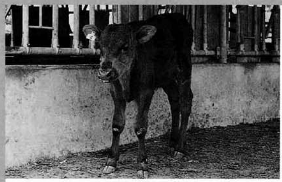
下牧の時には、どんなに大きくなるかな

六月六日、萱峠牧場で牛の放牧が行われました。放牧は、家畜保健所や中越農政事務所・普及センター・各農協・NOSA I中越等関係機関の協力を得て肥育牛生産組合員が中心になり、それぞれの牛舎から採血検査の済んだ牛をトラックで運び、現地で体重測定をしたあと、親牛二十頭・子牛十二頭のほかに種雄牛一頭が放され、青く生い茂った牧場の中を元気良く走り回っていました。秋まで、月一回の中間検査を行いながら、伸び伸びと育てられた子牛と受胎した親牛が下牧されます。