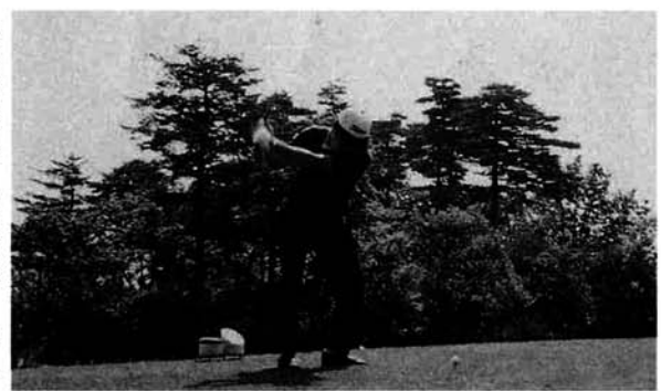
村長の始球式によりスタート