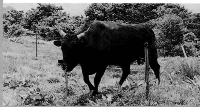
福和号に期待がかかります