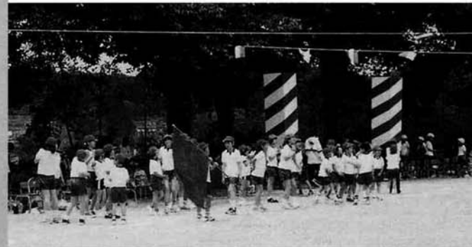
ガンバレ 大きな声で応援合戦