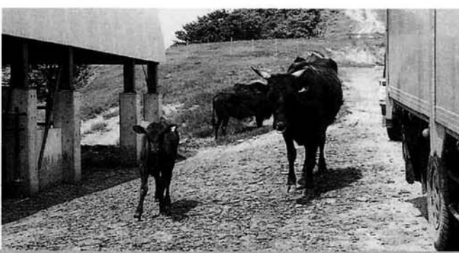
お母さんといっしょに思い切り遊びます