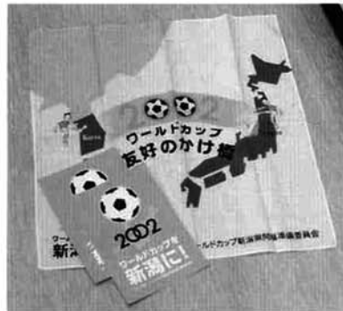
▲招致活動用パンフレットと友好ハンカチ

新潟県では「2002年ワールドカップを新潟に」という独自のシンボルマークをつくり積極的な招致活動を展開してきました。これからも情報を的確にキャッチし、積極的な行動をしたいと考えていますので、皆さんの御協力をお願いします。また、県開催を期待する県民の気運を高めるため、「友好ハンカチ」を販売しています(300円)。希望者は、教育委員会まで問い合わせください。