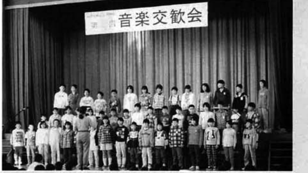
▲ひとりぼっちを合唱する五・六年生

十月二十四日、竹沢小学校体育館で村内小中学校児童生徒音楽交歓会が行われました。発表会では、最初に五、六年生全員による「ひとりぼっち」を合唱したあと、各学校からの発表が行われ、最後は全員で「里の秋」を合唱しました。「里の秋」を合唱しました。聴きに訪れた父兄や「ここにこ会」の会員が、きれいなハーモニイに拍手を送っていました。