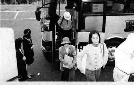
▲バスを降りてあまやち会館に向かう探訪ツアーの一行

長岡地域広域行政組合主催の地域探訪ツアーが十一月八日に行われ、近隣市町村から山古志村に三九名がやってきました。自分達の地域を知れば、ふるさとをもっと楽しくおもしろいと今回初めて計画されたもので、山古志村での探訪は『牛の角突き』と『四季の里古志』周辺の散策です。