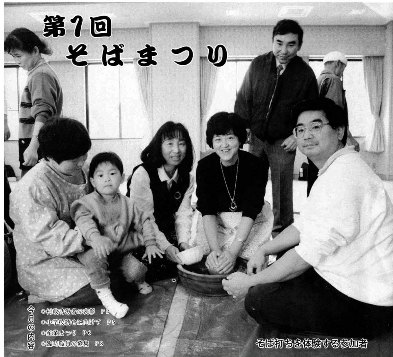
そば打ちを体験する参加者