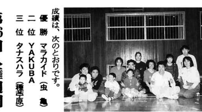
健闘した「ママ・パパ」チーム

成績は、次のとおりです。 優勝 マラカイド(虫亀) 二位 YAKUBA 三位 タナスハラ(種子原) 第46回人権週間