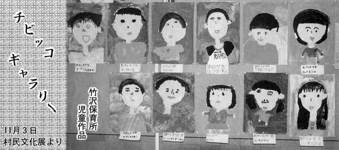
チビッコキャラクター、 11月3日 村民文化展より