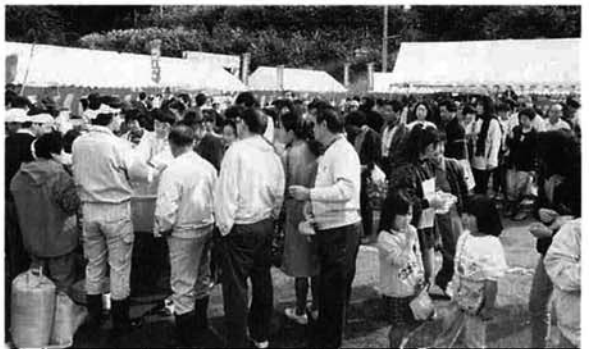
▲コシヒカリのつかみどりは訪れた人々に大好評

場内では、コシヒカリのつかみ取りや錦鯉のつかみ取り、餅つきなどが行われ、コシヒカリのつかみ取りには昨年の米不足を思い出させるような長い列ができ、大変好評でした。