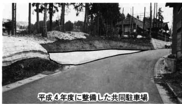
平成4年度に整備した共同駐車場

農業基盤整備事業として「農道舗装」の申込みを受け付けます。希望者は、五月末日までに産業課へ申込み下さい。(申込用紙は産業課にあります) この補助事業は、農道整備により農業経営の合理化を進めようとしているもので、補助対象は生コンクリート等の原材料費で、補助率は五十%です。