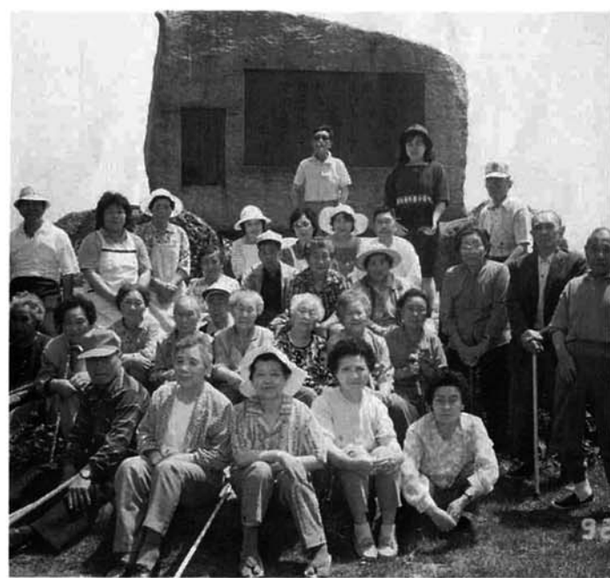
・小千谷山本山にて にこにこ会(機能訓練)の遠足スナップ