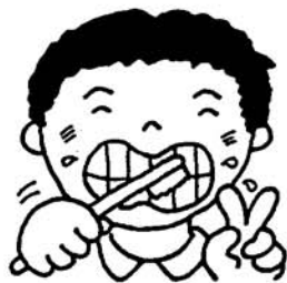
歯の衛生週間 (6月4~10日)