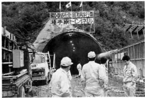
産業建設委員会のみなさん

村議会の二つの常任委員会（総務厚生・産業建設）では、四月から五月にかけて、所管事項にか