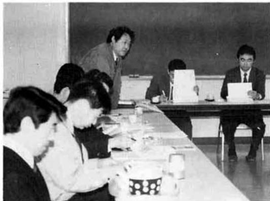
県担当者を招いての説明会

この会の目的は、御ゆきくに企画から市販されている「こいこく、こくしゅう、山菜加工品、どじょう鍋、ゆきもち」の味覚等を含め、市場ニーズに応えた製品の研究改