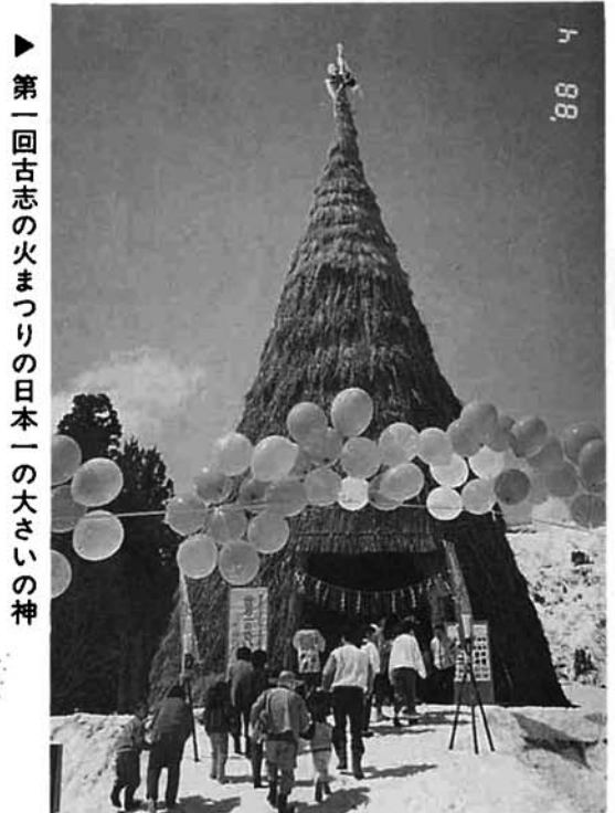
第一回古志の火まつりの日本一の大きい神

昨年せっかく多くの皆様のご協力により計画を進めてきた「古志の火まつり」でしたが、異常小雪のためやむなく中止となりました。今年こそは実現したいものです。この「第二回古志の火まつり」の実施に向けて、一月一七日に古志の火まつり実行委員会が村民会館で開かれました。この会議で決められたのはまつりの基本的事項で①今年は何号の小雪でも実施する。②期日は平成二年四月八日の日曜日とする。③場所は種彦原農村運動広場（スポーツ広場）とす