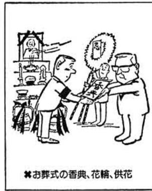
※お葬式の香典、花輪、供花

① 候補者等が寄付のできる場合。 ② 政党その他の政治団体又はその支部に対する場合 ③ 候補者等の親族（六親等内の血族、三親等内の姻族）に対してする場合 ④ 候補者等が専ら政治上の主義又は施策を普及するために行う講習会、その他政治教育のための集会に必要やむを得ない実費の補償としてする場合。ただし、この場合