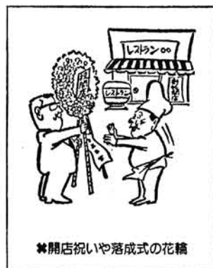
※開店祝いや落成式の花輪

「金のかかる選挙」から「きれいな選挙」へ転換を主眼として改正された公職選挙法が、昭和五十年十月から施行され一ヶ月が経過しようとしています。 改正の内容については、本紙に掲載したりチラシ等を配布してその周知を図りまた、テレビ、新聞等マスコミによつても再三報道されてきたところですが、いまだに改正の内容が選挙人全体に浸透してないむきもあり、質問や批判があとを絶たない現状です。そこで特に問題の多い、改正された寄付の禁止のことに