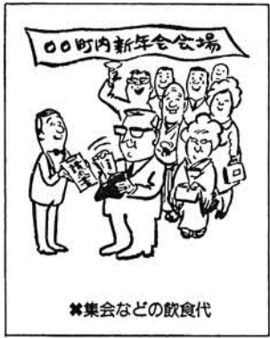
※集会などの飲食代

⑤ 候補者等の財源で、配偶者や後援会の名義を用いたり ⑥ 候補者等が選挙区内にある者に対して次のようなことをすることは、寄付として禁止されています。 ⑦ 中元や歳暮を贈つたり、別や入学祝等を贈ること。 ⑧ 選挙区からの国会見学者や陳情者に食事を提供したりみやげを持たせること。 ⑨ 名前や写真入りのうちわやカレンダーを配布すること ⑩ 他の選挙の候補者等に政治献金や陣中見舞をする ⑪ 行事に招かれたとき会費以外に包み金を置くこと。 ⑫ お祭りのときに、金銭や花火を寄付すること。 ⑬ 候補者等の財源で、配偶者や後援会の名義を用いたり