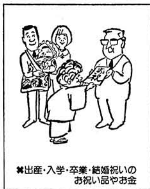
※出産・入学・卒業・結婚祝いのお祝い品やお金

「金のかかる選挙」から「きれいな選挙」へ転換を主眼として改正された公職選挙法が、昭和五十年十月から施行され一ヶ月が経過しようとしています。 改正の内容については、本紙に掲載したりチラシ等を配布してその周知を図りまた、テレビ、新聞等マスコミによつても再三報道されてきたところですが、いまだに改正の内容が選挙人全体に浸透してないむきもあり、質問や批判があとを絶たない現状です。そこで特に問題の多い、改正された寄付の禁止のことに