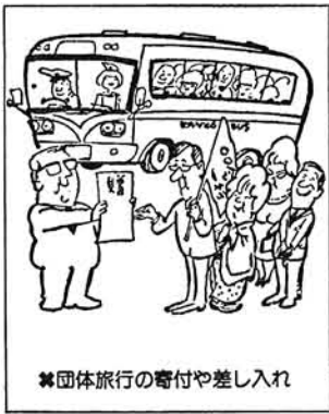
※団体旅行の寄付や差し入れ