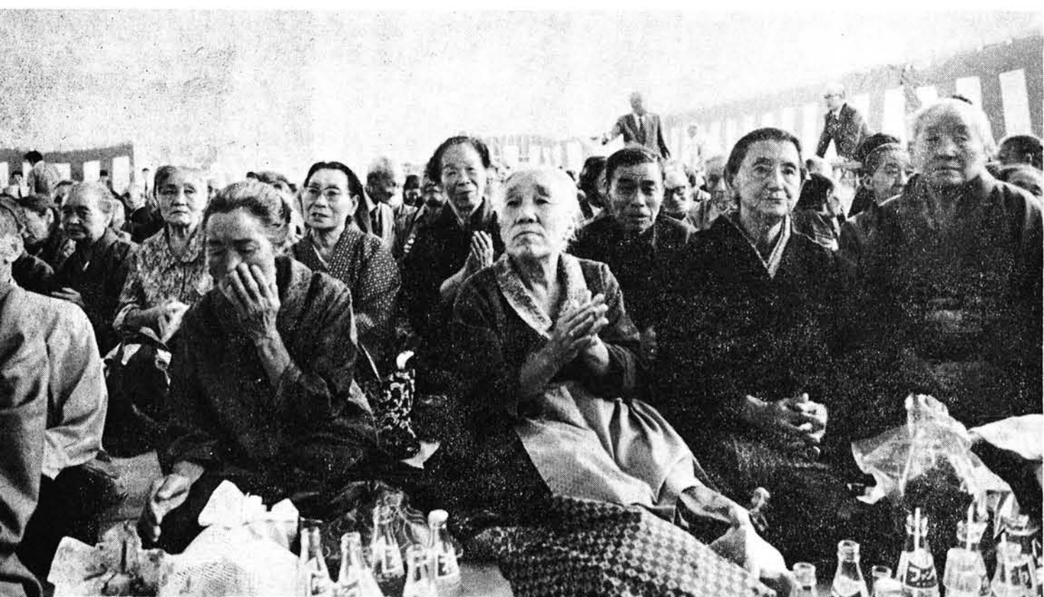
9月15日敬老会に、保育園児たちの遊戯等が行なわれ、楽しい一日でした。