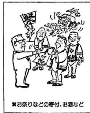
※お祭りなどの寄付、お酒など

公職選挙法における 寄付の禁止について 「金のかかる選挙」から「きれいな選挙」へ転換を主眼として改正された公職選挙法が、昭和五十年十月から施行され一ヶ月が経過しようとしています。 改正の内容については、本紙に掲載したりチラシ等を配布してその周知を図りまた、テレビ、新聞等マスコミによつても再三報道されてきたところですが、いまだに改正の内容が選挙人全体に浸透してないむきもあり、質問や批判があとを絶たない現状です。そこで特に問題の多い、改正された寄付の禁止のことに