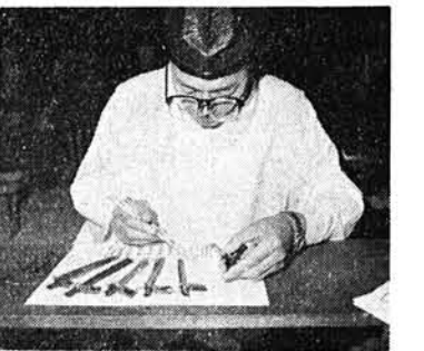
筒粥祭りの様子。粥を炊き、筒に札を付けたものを占う様子。

たばこは村内の小売店から買ひましょう。村の財源として、大きな役割を果しています。