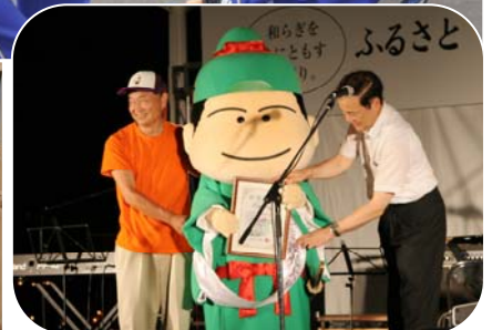
▲わし麻呂くんが「わししま観光大使」に就任しました！