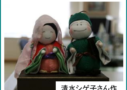
清水シゲ子さん作