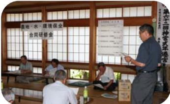
▲坂井地区環境保全向上隊の報告