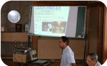
▲桐原環境保全の会による「ふるさと魅力発見」についての説明

荒巻地区の「農地・水・環境保全向上対策」の取り組みを参考にしよう、胎内市坂井地区の農家組合と坂井稲友会約25名が視察に訪れました。“桐原環境保全の会”の活動内容の報告や、マコモタケの栽培についての説明がありました。