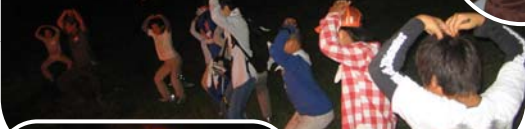
▲キャンプファイヤー