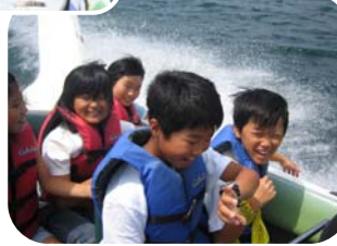
▲モーターボート体験(桧原湖)▲