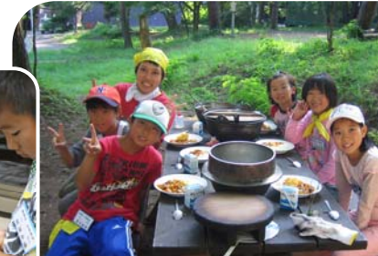
▲野外炊飯(カレーライス作り)