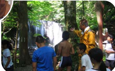
▲リトルアドベンチャー(達沢不動滝)