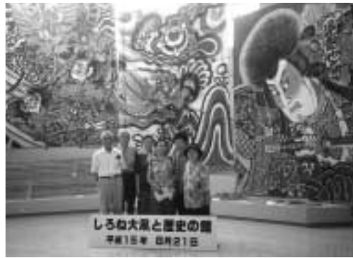
いきいき大学村外研修 こそこから聞こえていました。 夕方全員無事に帰村いたしました。