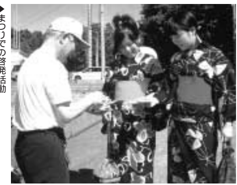
▶ まつりでの啓発活動

毎年7月に全国一斉に行なわれます法務省主唱の「社会を明るくする運動」は全ての国民が犯罪の防止と罪を犯した人達の更生に理解を深め、それぞれの立場において力を合わせ犯罪のない明るい社会を築こうとする趣旨のもと展開される運動です。この村内外における普及活動等の大きな財源となるのが皆様からお寄せ頂く会費であります。本年は次表のとおりの実績を収める事が出来ました。心から感謝申し上げます。