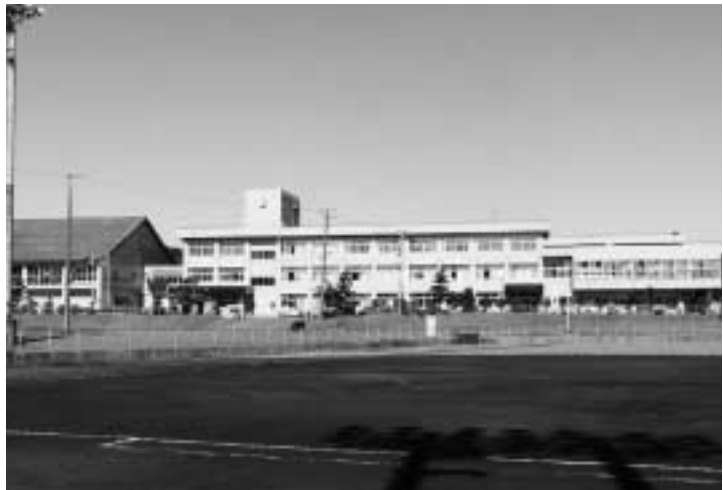
現在の北辰中学校