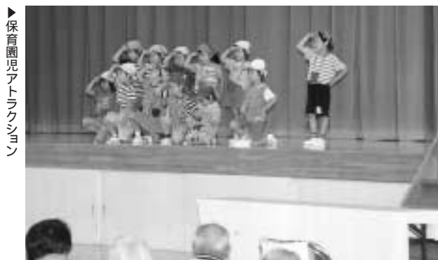
▶保育園児アトラクション