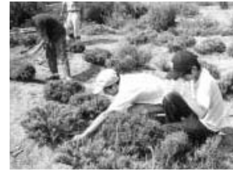
暑い中 がんばりました

猛暑の8月7日中沢のラビットファームにおいて草取りをさせていただきました。しかしあまりの暑さに参加生徒、スタッフ共にバテバテ。ラビットファーム指導者のご好意で頂戴したジュースで生き返りました。