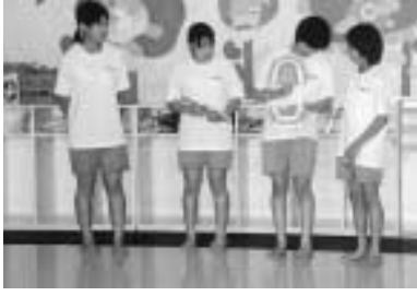
▶ 中学生歯科講演会