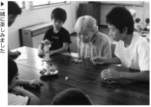
一緒に楽しみました

この日は、まずお茶席コーナーにてお抹茶を頂き、ゲーム・遊びコーナーでは中学生と児童クラブの子供たちと一緒に水ぬりえ等で童心に返って遊んでいたいただきました。 昼食会ではこの日のメニュー、なめこおろしそば、てんぷら、酢