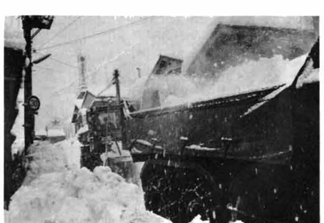
生活道路確保に昼夜兼行作業 17日から27日まで交通が 止められた(1月20日大野)