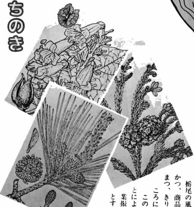
まつ きり すぎ