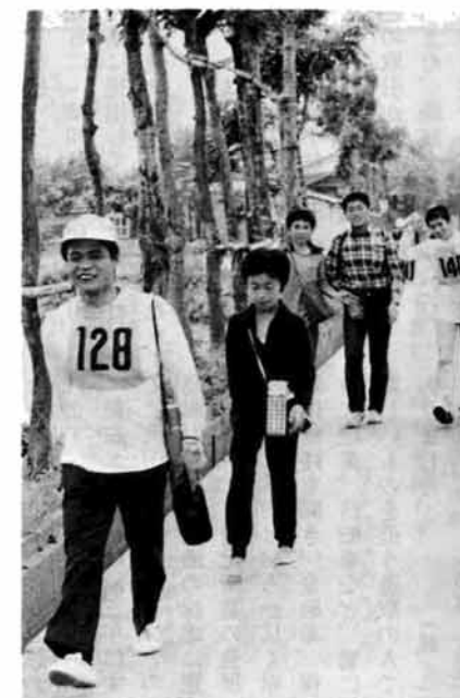
(親子そろって 楽しいオリエンテーリング)