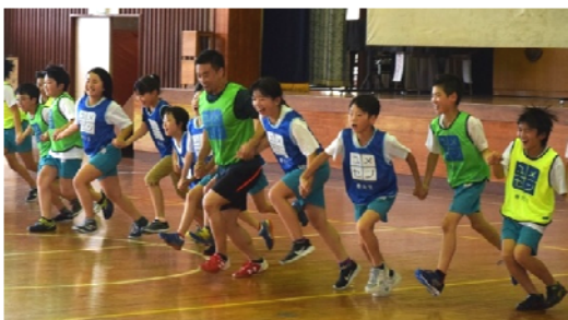
7月10日(火) 栃尾南小学校 一流アスリートが特別授業