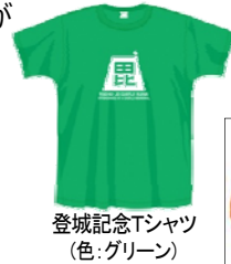
登城記念Tシャツ (色:グリーン)

★当日開催可否の照会 栃尾支所地域振興課 ☎080-1245-9433(午前5時30分～6時)