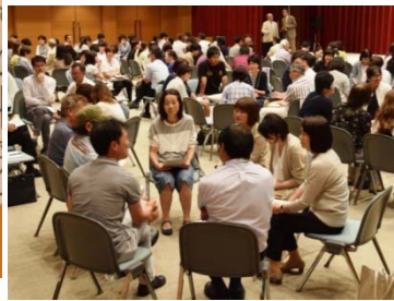
6月23日(土) 栃尾産業交流センター 子育て講演会 長岡市栃尾地域のなみこ創生基金事業