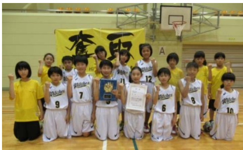
7月1日(日) 栃尾体育館 栃尾地域近郷ミニバスケットボール大会

スポーツを通して近隣地域の子どものための交流を深めるため市が主催しているこの大会には、栃尾地域のほか中之島地域、見附市、三条市、田上町から女子の11チームが参加。地元栃尾のウィッチーズが優勝しました。