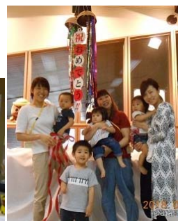
7月~10日(土) 子育ての駅「かほろ」 「かほろ」の歳はめぐり

支所地域の子育ての駅第1号としてオープンした「すくすく」が6周年を迎えました。誕生祭ではお誕生月の親子がくす玉を割り、コンサートなどが行われました。