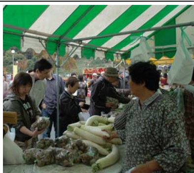
▲栃尾地域農業まつりがR290道の駅とちおで開催され、新鮮な野菜などの農産物を買求める人でにぎわいました。(10月28日)