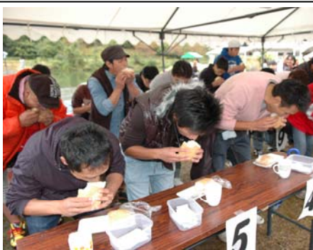
▲杜々の森名水公園で開催された、「あぶらげまつり・コシヒカリまつり」。約1kgの寿司の早食いを競う「あぶらげ寿司の早食い大会」などが行われました。(10月28日)

申込み・問合せ 11月12日(月)までに電話で栃尾支所地域振興課へ ☎52-5815