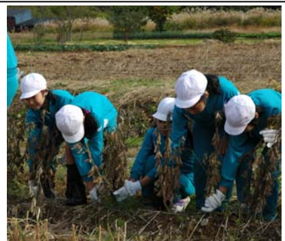
▲栃尾南小学校の5年生が山内原で大豆の収穫をしました。この大豆は6月に自分たちで種まきをしたものです。収穫後は大豆を使ってあぶらげを作る予定です。(10月30日)