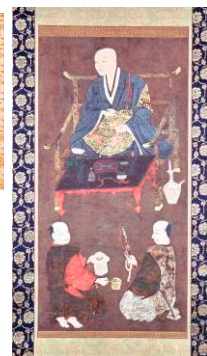
紙本著色上杉謙信 並二臣像(栃尾・常安 寺所蔵) 左下が兼続と伝えら れている