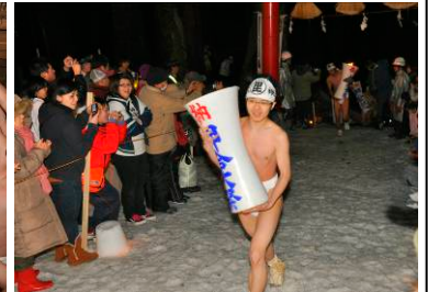
大ローソクを先頭に男たちが堂内になだれ込む