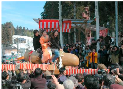
初嫁を乗せた御神体

高さ2.2m、重さ600kgの日本一大きい木彫りの陽根型の御神体に初嫁を乗せ、五穀豊穡、子宝や良縁、子育てなど豊かな実りを祈願する祭りです。