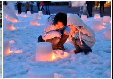
前夜祭では雪洞の灯りと花火が冬の夜を彩りました