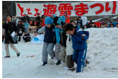
5人6脚タイムレースは30チームが参加し熱戦?が繰り広げられました

「道の駅 R290 とちお」を会場に行われたとちお遊雪まつり。雪上ゴルフや雪上キックターゲットに挑戦した子供たちは、景品をもらってニッコリ。「味じまん市」では石焼きいもやすいとん汁など温かい食べ物がずらりと並び、多くの人でにぎわっていました。