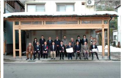
今年度建築した雁木で記念撮影