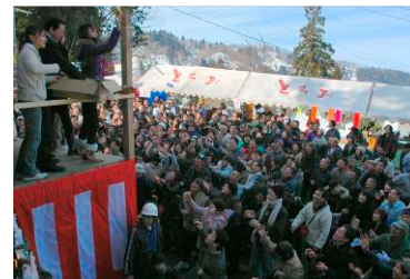
富くじ撒与(さんよ)のようす