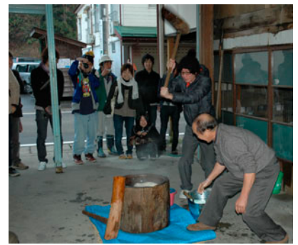
住民と学生たちは、もちつきで建築を祝った。