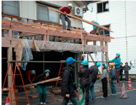
設計した学生たちも手伝って、雁木が建築された。

平成9年から雁木を利用し、住民・学生・行政の協働でまちづくりを進めている表町地区。10番目となる雁木「双柱の雁木」が建築されました。建築を見守る住民は「安定感のある、雁木らしい雁木ができた」と笑顔で話していました。