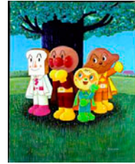
木の下の子 ©やなせたかし/フレーベル館・TMS・NTV