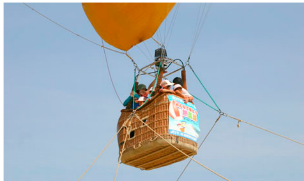
栃尾南小学校グラウンドで行われた JC スクール。熱気球に乗った参加者は「揺れた時は、少し怖かったけど面白かった」と笑顔で話していました。