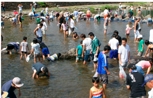
栃尾フィッシングパークでは子どもたちが、暑さを忘れてニジマスと格闘していました。