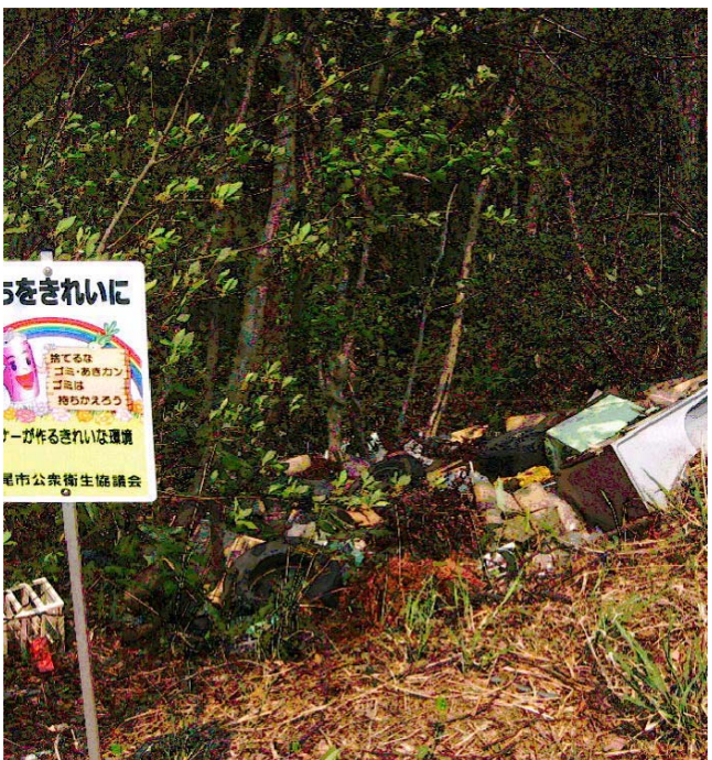
林道や雑草が伸びた所には廃家電などが投棄されています。豊かな自然環境を一緒に守りましょう

悪い道路わきなどが、ごみの投棄されやすい場所です。長期放置場所も不法投棄として狙われる場所です。立看板などの設置も対策のひとつですが、雑草なども伸び放題にせず、ごみが捨てられた場合はこまめに清掃し、きれいな状態にしておくことが効果的です。