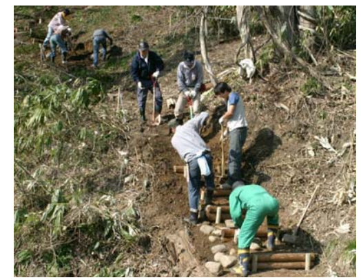
作業に汗を流す皆さん

ボランティア二十六人が秋葉トンネルの大野側から秋葉公園に登る「入道坂」を整備しました。入道坂は昔、秋葉公園と大野町や表町をつなぐ道として利用されてきましたが、利用者の減少とともに忘れ去られてしまい、いつしか荒れ放題。そこで、つまりまつりに合わせて実施した「とちおまちめぐり」雁木