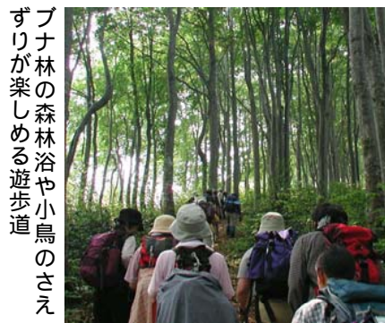
ブナ林の森林浴や小鳥のさえずりが楽しめる遊歩道