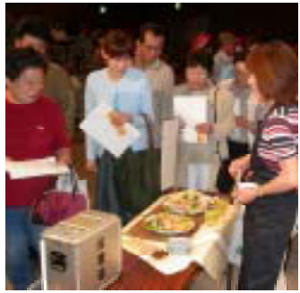
あぶらげ料理コンテスト

バザールコーナー あぶらげ、饅頭、笹団子、大福、醤油、みそ、木炭、陶器、野菜、山菜などの展示即売 ファッションコーナー フリーマーケット(先着70区画) 出店料五百円でどなたでも出店できます。 申込み・問合せ 商工観光課 ☎ 522151