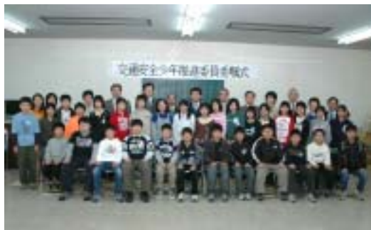
交通安全少年推進委員のみなさん

春の全国交通安全運動が、四月六日から十五日までの十日間行われました。 栃尾市では交通安全パレード、朝と夕方の街頭指導、ドライバーと歩行者のチラシ配布などを実施し、交通安全を呼びかけました。期間中、交通安全協会の皆さんをはじめ多くの人が交通安全運動に参加しました。