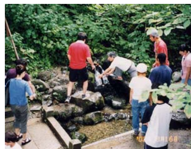
名水を求めて訪れる人たち

園内は、20区画のテントサイトやシャワー室を備えたキャンプ場、アマチュアの作品も展示する名水会館アトレと、名物よもぎうどんが好評なレストラン銘森、地元の新鮮野菜も販売