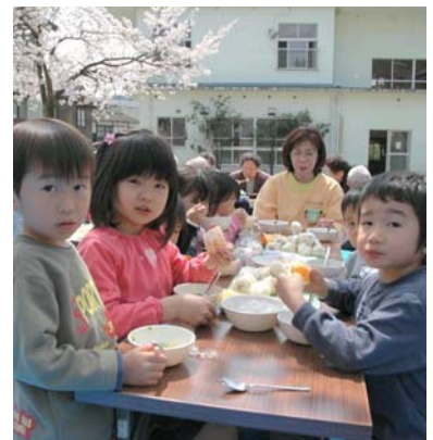
満開の桜の下でお花見給食

中央保育所では、桜が満開になった四月十三日、お花見給食を行いました。園児たちは、風に舞う桜の花びらに「わあ、きれい！」と大はしゃぎ。給食が配られると、桜に負けない満面の笑顔で「すっごくおいしい！」とおにぎりをほおばっていました。