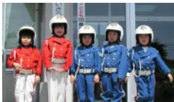
天使幼稚園の「ちびっ子白バイ隊」も運動に参加

歩行者に思いやりのある運転を 暖かい春を迎え、人も車も動きが活発になってきます。ドライバーのみなさんは、登下校中