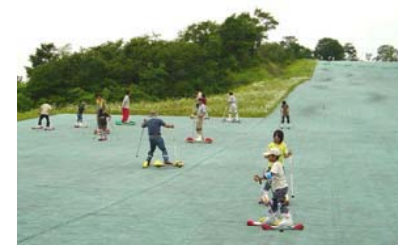
高原のさわやかな風を受けて滑るグレステンスキーは格別