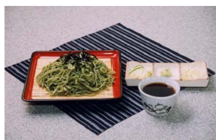
よもぎの香りが口いっぱいに広がるよもぎうどん。お土産用もあります

しているところハウス、名水茶会の会場となる望岳庵など施設が充実。秋にはあぶらげまつりも行われます。家族、友人との思い出づくりに最適です。 キャンプ場料金 入場料 200円 宿泊 テント1張り千五百円 問合せ アトレと ☎58 3050