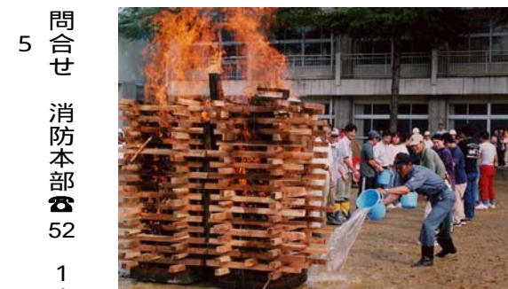
昨年9月に行われた消防防災訓練

消防防災訓練 とき 6月6日(日)7時30分 ところ 金町・大町地区(主会場: 栃尾東小学校) 朝8時00分に、消防署のサイレンを30秒間鳴らします。 訓練内容 ○住民による避難、消火、救護訓練 ○一斉放水、火災防ぎよ ○応急救護、初期消火 ○幼年消防クラブ演技披露 ○県消防防災ヘリ救出訓練