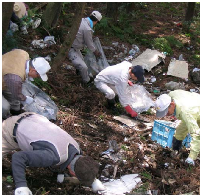
赤谷・吹谷地内の不法投棄撤去作業。市は地域が積極的に取り組む活動を支援します