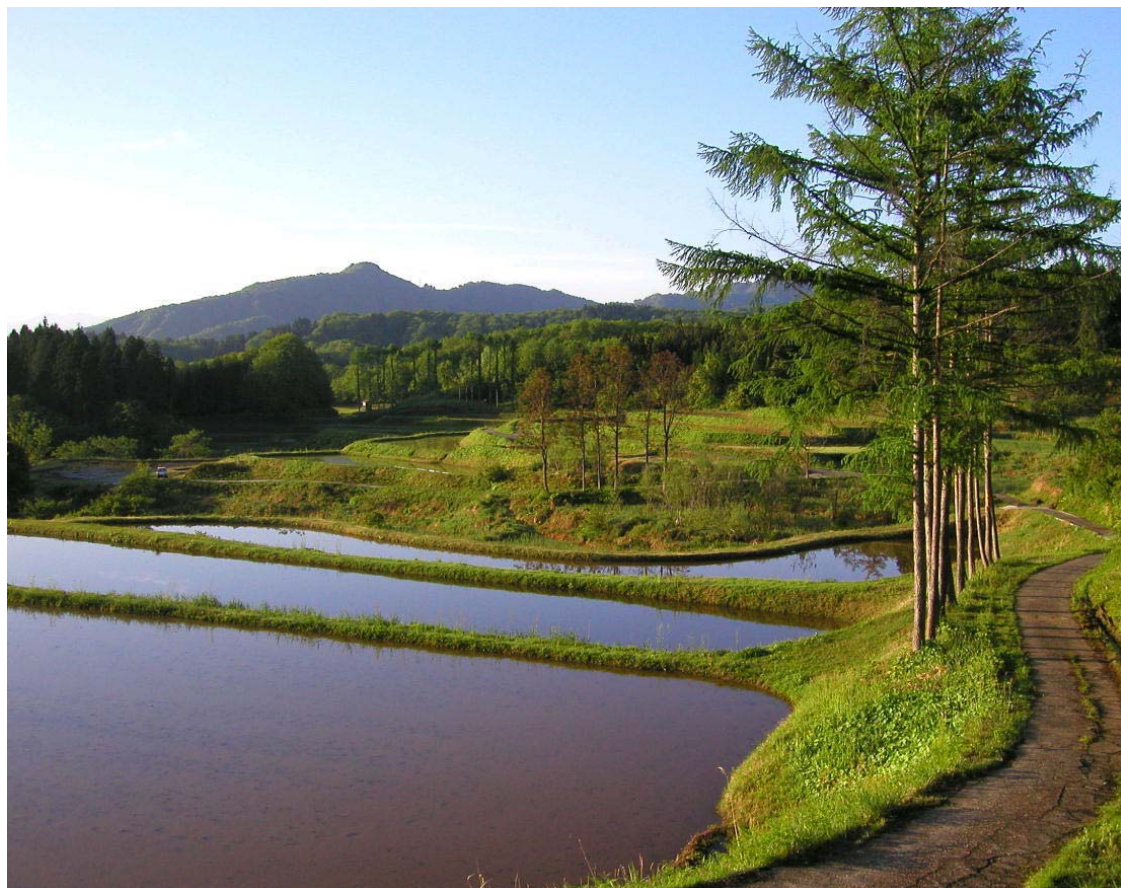
栃尾市の美しい棚田風景。後世に残したい美しい郷土は、そこに住む私たちが守っていかなければなりません

栃尾市をきれいにするための条例 第1条 この条例は、市民が郷土に愛着と誇りを持てる生活環境づくりをめざし、市民一人ひとりが栃尾市をきれいにしようとする意識を育み、快適で安全なやさしいまちづくりに資することを目的とする。