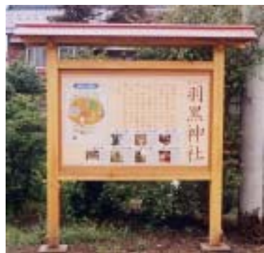
小貫区では昨年、羽黒神社を核に地域づくりを行おうと、案内板などを整備しました

二〇万円以上の事業に対し、予算の範囲内で最高七十五パーセントを助成します。ただし、交付限度額は百万円です。申込み・問合せ 企画財政課 ☎52 5816