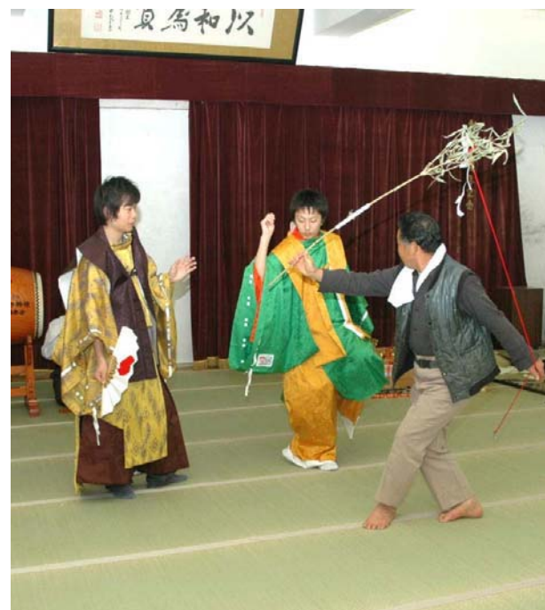
約130年ぶりに衣装・楽器・小物一式が新しくなり練習に一段と熱が入る保存会の皆さん