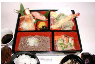
おすすめ定食。山菜やアスパラガスなど、道院特産の食材や栃尾名物あぶらげも味わえます

道院特産の食材を使った「おすすめ定食」、または「野外バーベキュー」のどちらでも好きな昼食をお楽しみください。