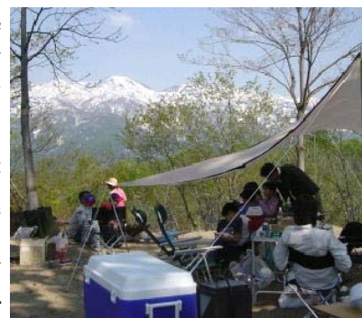
越後屈指の名峰「守門岳」が一望できるオートキャンプ場