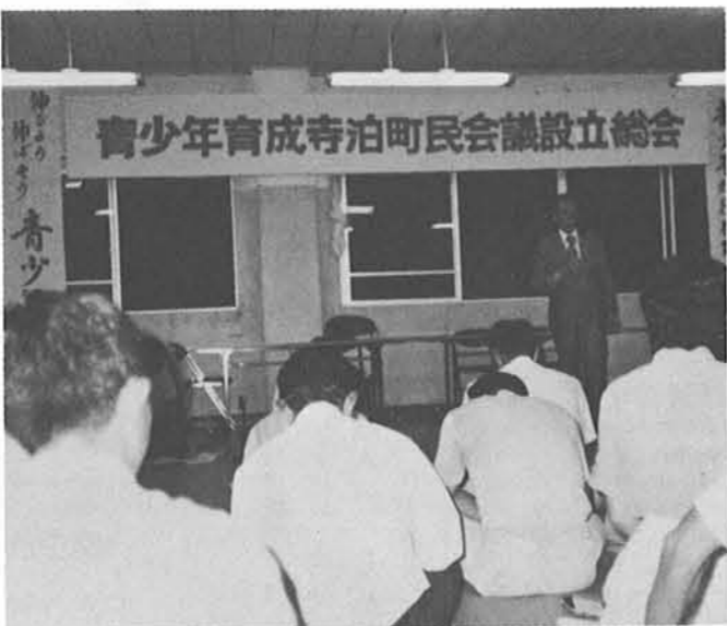
▲活発な活動が話し合われた設立総会

「最近の新聞・テレビでは、青 少年の非行や犯罪の報道が多くな っている」「刺殺通り魔や少女悪戯 事件、集団万引、校内暴力、暴力 団とのからみ、異性刺傷事件等ニ ューズのネタは絶えない」「この町 でも万引、盗み、暴力、バイクの 暴走等いろいろな問題が起きてい る」