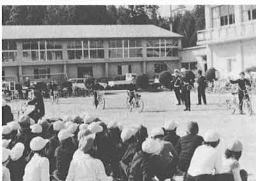
自転車乗りの交通ルールとマナーを勉強する児童たち

春の交通安全運動の一環として自転車の安全利用のために街頭指導が実施されました。 警察、交通指導員、安全協会、自転車商組合と一緒に与板高校寺泊分校前ほか三ヶ所で指導点検を行った自転車は一六一台で、その内六二%の一〇一台が修理あるいは調整の必要な車でした。 特に重大事故につながるブレーキの不良が二台もありました。これらの不良車は中学生にはほとんどなく大人の使用する自転車に多く見られましたので、通勤や買い物に利用される方は定期的に点検整備を行ってください。