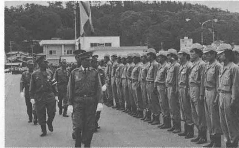
▼テキパキと日頃の訓練を披露 力強い闊歩