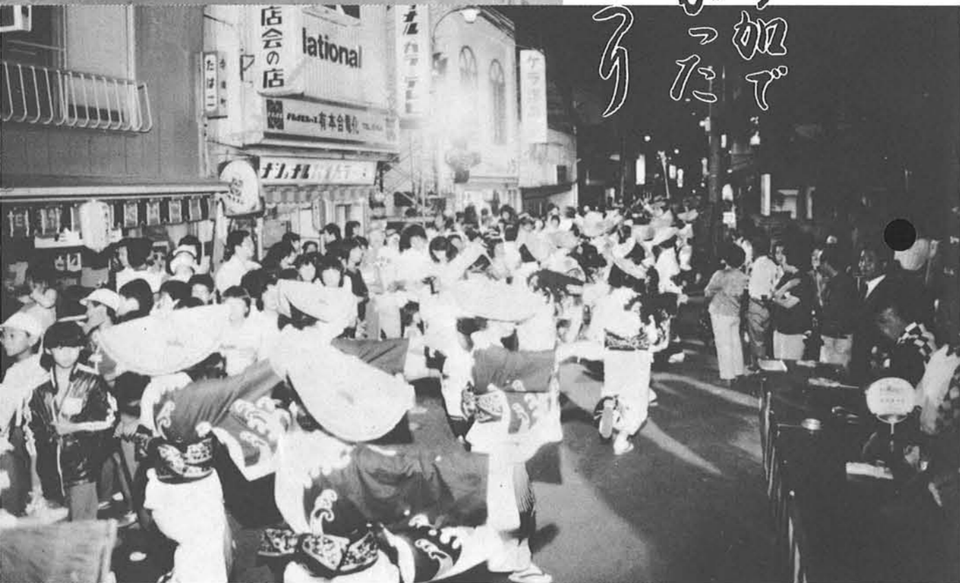
▶前夜祭を盛りあげた寺泊おけさ流し ▶港まつりに花をそえた音楽隊パレード

〈人口の動き〉 昭和56年8月1日現在 人口13,564人(男 6,570 女 6,994) 3,085世帯 ( )は前月比 (+11) (+9) (+2) (+1)