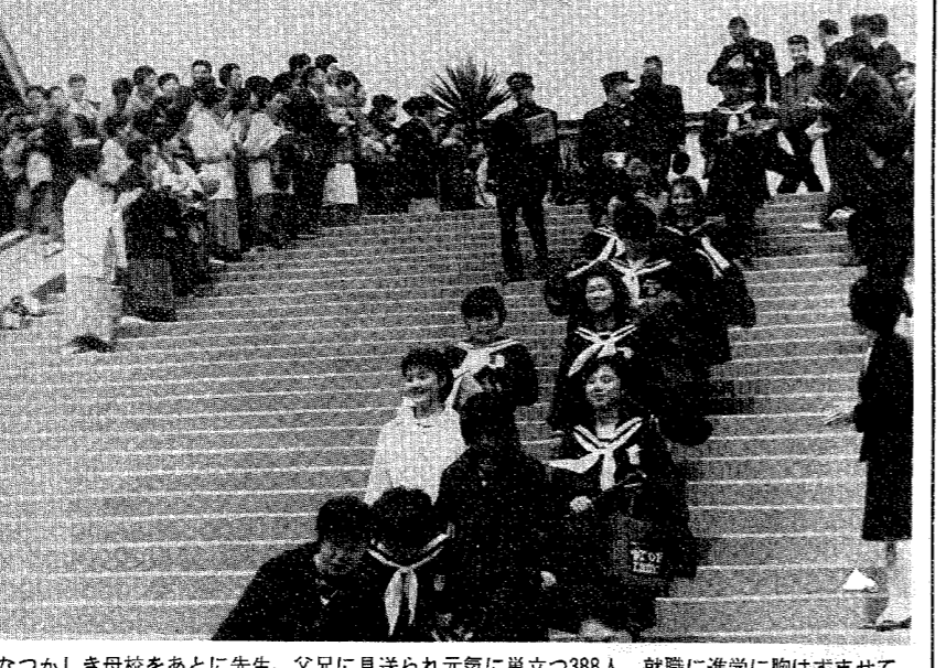
なつかしき母校をあとに先生、父兄に見送られ元気に巣立つ388人、就職に進学に胸はずませて