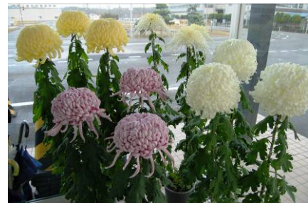
寺泊文化祭に出品された菊は、大河津自動車学校の玄関に飾られています。