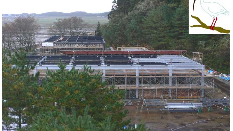
↑工事が進むトキ分散飼育施設（夏戸地内）