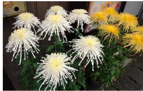
愛情をたっぷり注いで丹念に育てた菊