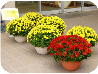
伊勢崎市から菊が寄贈されました。(寺泊支所玄関)