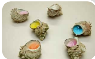
▲サザエの貝殻を利用したローソク