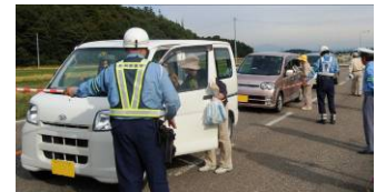
▲交通指導所の設置(9/30)