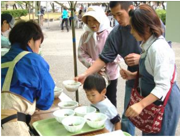
▲アサリ汁のふるまい