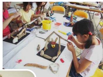
▲海岸に漂着していた木片やプラスチックなどを材料にした『流木アートづくり』

9月20・21・23日の3日間で開催された「越後長岡暮らし文化の祭典」。合併した10地域の芸能の披露や、地域の特色を活かした体験や実演、物産販売など、内容が盛りだくさん。寺泊地域は21日に地域の魅力を発信しました。