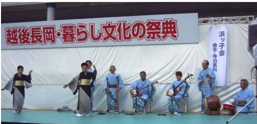
▲浜ッ子会の皆さんによる寺泊甚句