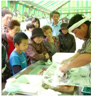
▲鮭の塩引づくりの実演