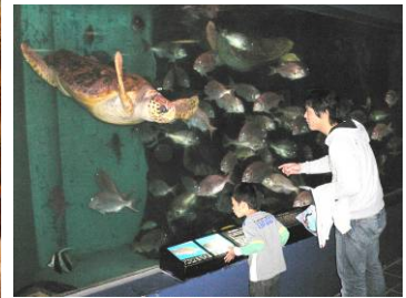
▲水族館の見学 (高波により、釣り船乗船体験の予定を変更)