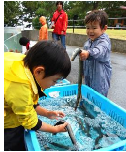
▲タッチングプールは子どもたちに大人気

9月27日、みなと公園を会場に開催したこのイベントには、市内外から1200人が来場し、寺泊の「海と魚」を堪能しました。 寺泊地域が「海」という地域資源を活かしたまちづくりを進め、地域の魅力をアピールするために、ふるさと創生基金事業として開催したものです。