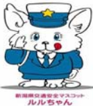
新潟県交通安全マスコット ルルちゃん