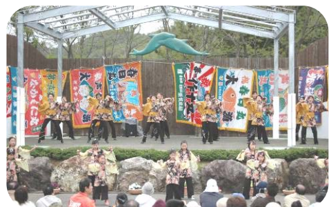
▲昨年のよさこいフェスティバルの様子