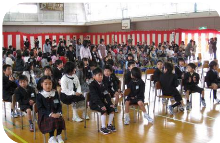
4月7日(月) 大河津小学校 新1年生 46人