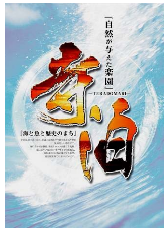
▲採用された平成20年度の寺泊観光ポスター

観光関係者による審査の結果、東京都の(株)アド・コアさんの作品を採用することに決定しました。