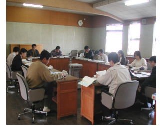
ふるさと創生事業実行委員会