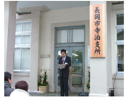
長岡市寺泊支所開所式

これに伴い、庁舎も長岡市寺泊支所と名前を変え、新たなスタートを切りました。この他にも、寺泊地域のまちづくりに対する提言や市長の諮問に対する答申などを行うための市の附属機関として、旧議会議員、学識経験者、地域の代表者で構成する「寺泊地域委員会」が発足しました。