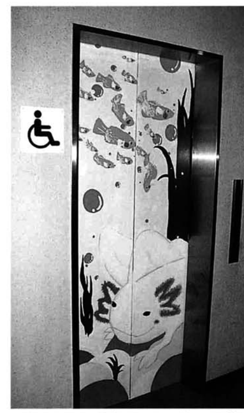
↑3階イラスト「ヴァーパルーパー、メダカ」

水族博物館には一階から三階までエレベーターが設置されていて、観覧者の方に利用していただけるようになって