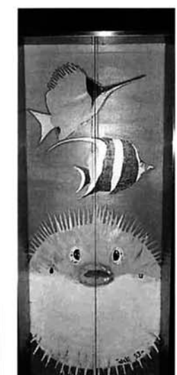
↑1階イラスト「ハリセンボン、チョウチョウウオ」

いますが、一階のエレベーター付近が暗く、エレベーターを利用しづらいという印象が以前からありました。そのため、エレベーター口付近を明るくするための照明の設置とエレベーターの扉に水中生物のイラストを描いて、楽しい雰囲気を作ることによって解消することにしました。