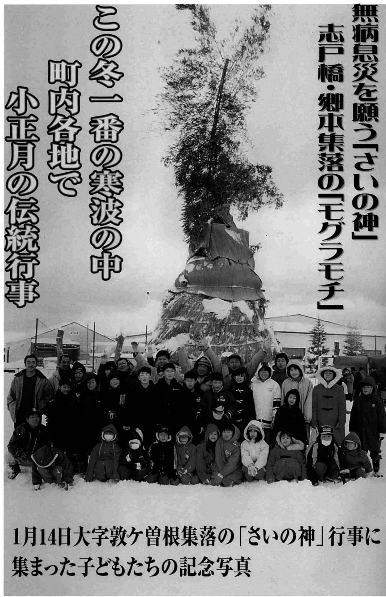
1月14日大字敦ヶ曾根集落の「さいの神」行事に集まった子どもたちの記念写真