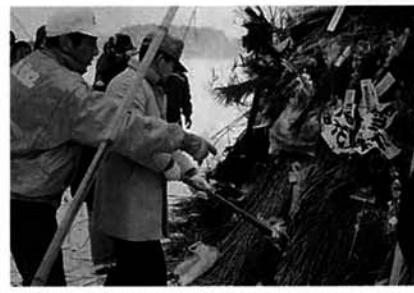
さいの神に火入れ (夏戸)