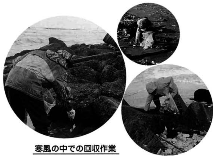
寒風の中での回収作業