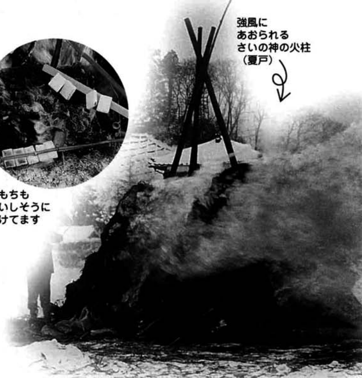
強風にあおられる さいの神の火柱 (夏戸)