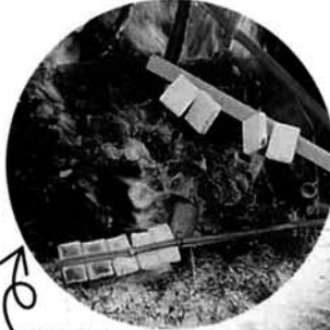
おもちゃ おいしそうに 焼けてます

掲載した他に、まだまだ多くの集落で「さいの神」が行われましたが、開催日・時間が集中しているため紹介できませんでした。「さいの神」を作るための材料確保や、人手の手配など大変でしょうが、これからも、この伝統行事が続くようお願いいたします。