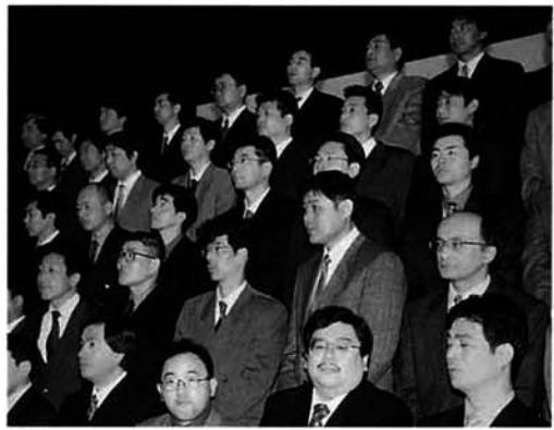
文化センター「はまなす」での記念撮影

70年以上の歴史がある寺泊町の三厄合同除厄祭が、1月8日白山媛神社(大町)において行われました。 除厄祭の後には、文化センター「はまなす」に会場を移し記念撮影、記念講演が行われ、久し振りに会う同級生と近況を話したり、携帯電話の番号を教え合ったりと、和やかな雰囲気でした。 心身ともに疲れが出てくる時期ですので、体調には充分注意してください。