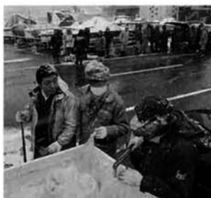
冷たい風と雪が降る中での回収作業、たいへんありがとうございました。

4年前のロシア船籍ナホトカ号の重油流出事故の際には、町民の皆さんから多大な協力をいただきました。あの事故以来、毎年海岸清掃を行ない私たちの大事な財産である海岸を守ってきました。これからも、皆さんの協力をお願いいたします。