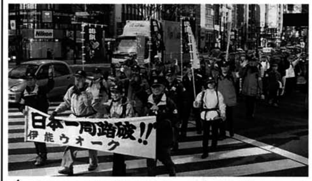
↑ 2001.1.1東京晴海通りをパレード

2年前の1月29日東京を出発した伊能ウォーク本部隊は、北海道を周り日本海側を歩き寺泊町に9月7日到着。一泊した後、出雲崎までの15kmを町民の皆さんとともに歩き番屋汁を一緒に食べました。 その後二行は、一年余りの歳月を費やし、2001年1月1日最終ゴールの東京・日比谷公園に無事到着しました。 実に、57日間一万一千三十キロの長い長い旅でした。