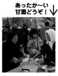
あったか〜い 甘酒どうぞ！