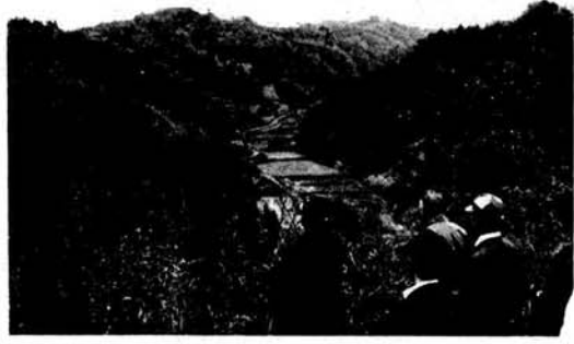
森林公園から見た小国沢城（別名を小松城）

まず、水路について見るならば、町の 南端関田、八石の両山脈の相迫るあたり、 苔野島城と三桶城ががっちりとその喉元 をおさえ、中流最も盆地の開けるあたり、 大脇城、貫輸山城が眼下に川面をにらみ、 下流の関門には、大沢、小坂、御館、中山 の諸城が大手を拡げて立ち塞がっているの である。一方陸路では前述の柏崎―安田 ―北条―広田―千谷沢―山宿―小千谷 を結ぶ軍用道の備えとして、中山、小坂、 御館、に加えて釜ヶ入城が築かれて、か つてこの道が軍用道であったことを如実 に物語っている。同じく柏崎―鯖石―三 桶―大貝―木落―十日町―関―湯沢―三 国峠を結ぶこの一線はやはり苔野島城及 び三桶城がおさえしている。以下、諏訪井 から真人へ出る横根峠は諏訪井城が、法 末を経て若栃方面へ抜ける道見峠は法末 城が、また関田越えとして最も重要な小 国峠は小国沢城および時水城が、そして 中央部から小国峠へ出る新町峠は法坂城 が、桐沢から小千谷城川へ出る桐沢峠を 桐沢城と釜ヶ入城が、さらに七日町千谷