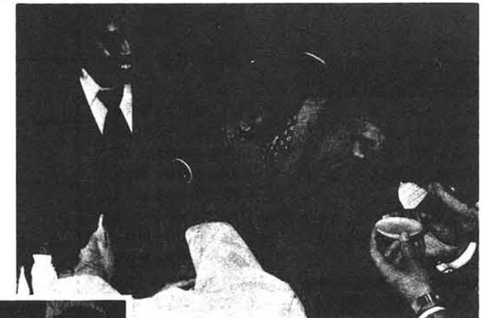
御神酒をいただく新成人