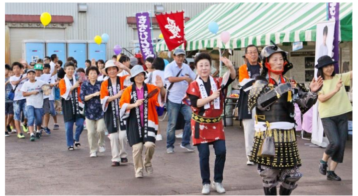
参加者が一体となった小国音頭では、小国中学校の生徒が唄を歌い、会場に大きな踊りの輪を作りました。