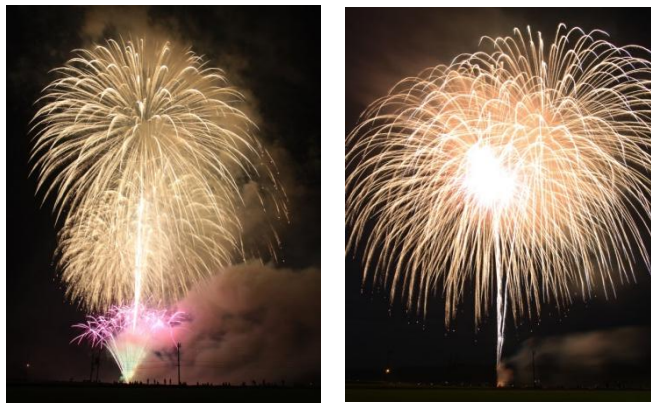
小国の夏を締めくくる大花火大会では、2,000発の花火が打ちあがり、夜空をまばゆく彩りました。