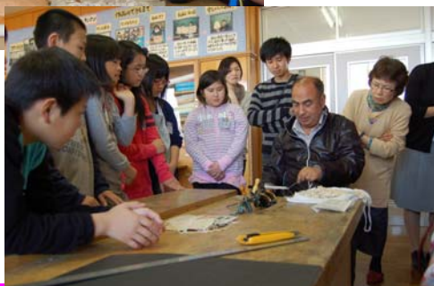
渋海小学校での特別授業の様子