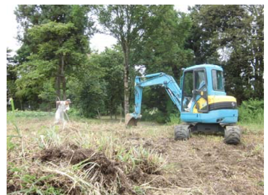
昨年 8 月の除草作業や抜根・整地の様子