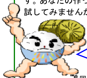
長岡うまい米キャラクター「まんまくん」