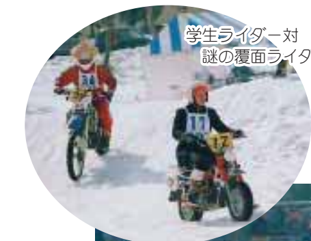
学生ライダー対謎の覆面ライダー

2月23日、おぐに運動公園において恒例の雪上エンデューロ大会が開催されました。積雪量が少なく開催が危ぶまれましたが、実行委員の皆さんの努力により見事なコースが作り上げられ、当日は県内外から180名近くのライダーが終結し熱いレースを繰り上げました。競技結果は下記のとおりです。