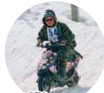
今年もパフォーマンス賞ねらい!?