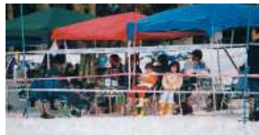
家族ぐるみの応援団