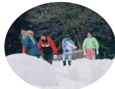
スタッフによるコース整備