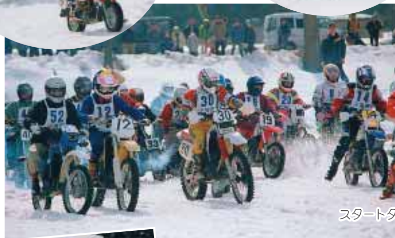
スタートダッシュ