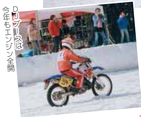
今年もエンジン全開