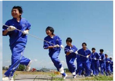
▲力を合わせて全力疾走！中之島中学校1年生の地絡め体験

◀中之島中央小学校5年生は、手作りの凧を手に、元気よく堤防を走り、空高く凧を揚げました。