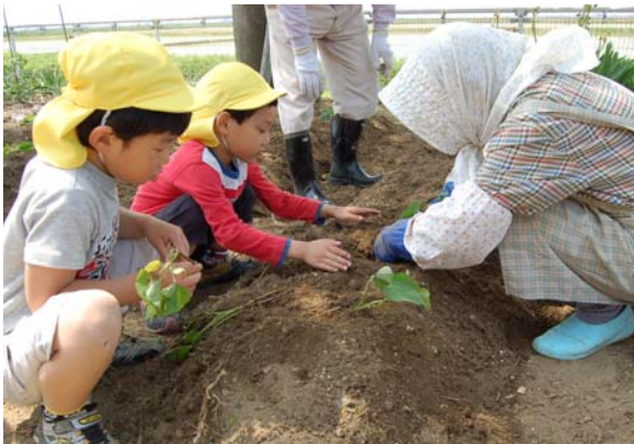
▲園児の祖父母を招き、年中・年長組が一括に、園内の花壇や畑に苗を植えました。収穫が今から楽しみです。早く大きくなあれ♪