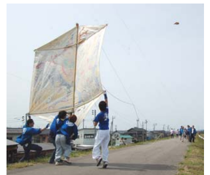
▲豪壮日本一を誇る凧の大きさは迫力満点！！