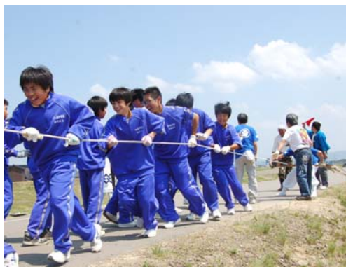
▲力を合わせて全力疾走！中之島中学校1年生の地絡め体験。