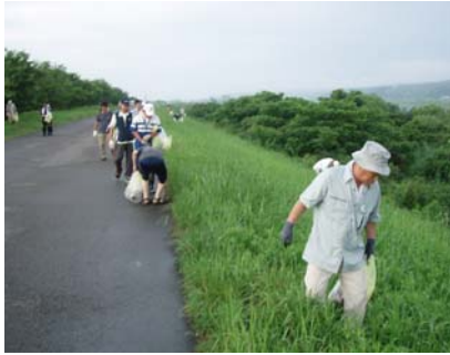
▲昨年のクリーン作戦の様子