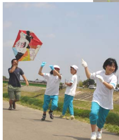
▲中之島中央小学校5年生は自分で作った凧を揚げました。