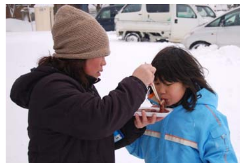
▲寒い中の温かい大沼のもちは格別！