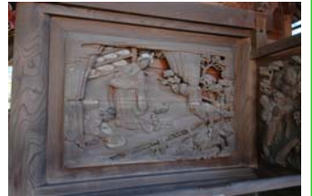
▲貴渡神社 石川雲蝶の彫刻