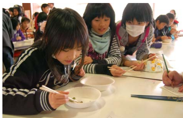
▲みんなの視線を浴びて緊張する？でも集中!!

そして、自分の心の中にいる鬼(いじわる鬼、風邪ひき鬼など)を「鬼は外！福は内！」の大きな掛け声とともに豆をまき退治しました。