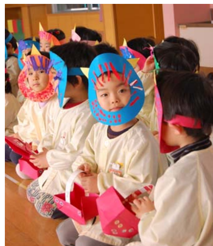
▲僕の鬼のお面キマっているでしょ？