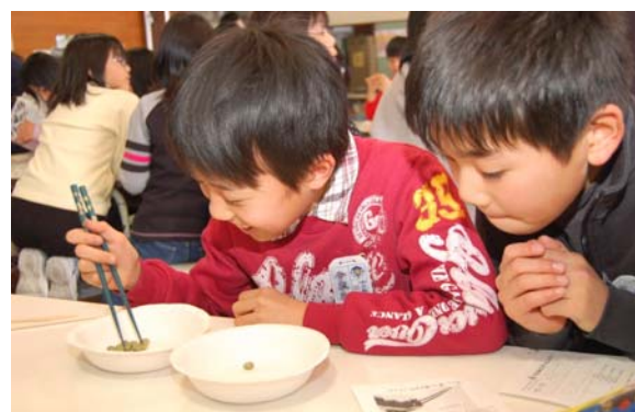
▲あと少し、ガンバレー!!

簡単そうに見えて、実はなかなか難しい豆つかみ。お家でもぜひ挑戦してみてください。