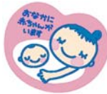
ママ・パパマーク