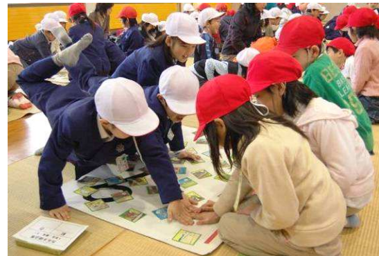
▲ 身のこなし鮮やかなカルタ取りを披露。

中之島つくろう塾による恒例の「新春ふるさとカルタ大会」が中之島公民館で行われました。22日は保育園年長組の園児、24日は小学1,2年生の児童たちが参加し、中之島地域の歴史、風物、四季を盛り込んだふるさとカルタを元気に取り合いました。