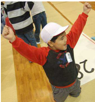
「やったあ ツッポース」 ▲ 勝ったあ！勝利のガッツポーズ