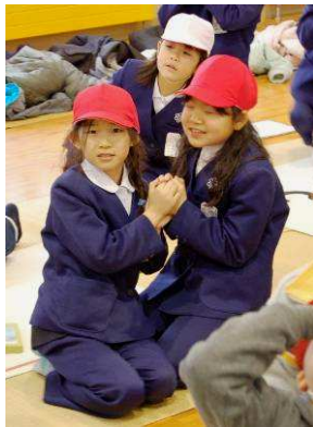
勝利の行方は...緊張するよう、ドキドキー