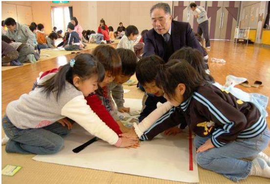
▲ 6人の手が一斉に一枚のカルタに重なる瞬間。