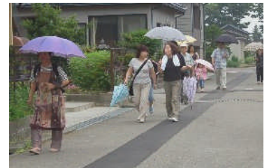
避難訓練は避難所までの経路を確認しながら1400人もの住民が参加されました。

梅雨末期、集中豪雨が懸念されます。各家庭や町内会等で防災対策について今一度検討をお願いします。