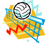
婦人バレーボール大会

6月25日(日) 中之島中央小学校体育館 優勝 TEAM YUTAKA 準優勝 酒好人 第三位 信条、アタック No.2