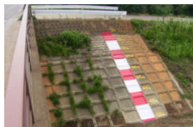
中西橋(護岸ブロック)