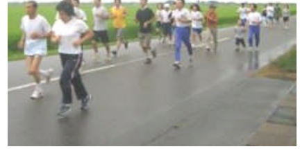
早朝の澄んだ空気の中で爽やかな汗を!

日 時 平成18年8月12日(土) 少雨決行 集合 午前6時15分 午前6時30分スタート 集合場所 JAカントリーエレベーター駐車場(上沼新田) コース カントリーエレベーター脇の一般農道 2 km、3 km、4 kmコース別