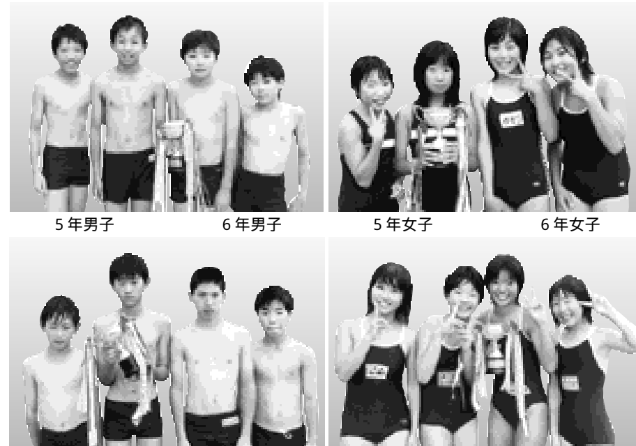
5年男子 6年男子 5年女子 6年女子